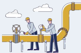
Industrie pétrolière et gazière