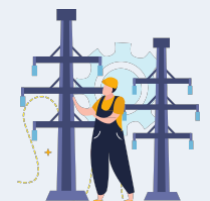
Services publics et infrastructures