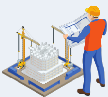
Architecture et services d'ingénierie