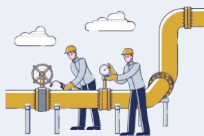
Distribution de gaz naturel