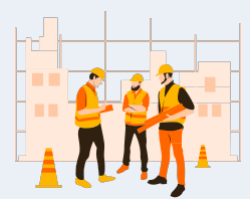
Fabrication de produits d'architecture et d'éléments de charpentes métalliques