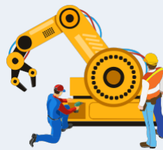
Réparation et entretien de machines et de matériel d'usage commercial et industriel