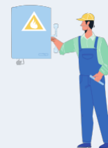
Entrepreneurs/entrepreneuses en installations d'équipements techniques