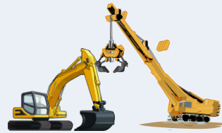
Fabrication de machines pour l'agriculture, la construction et l'extraction minière