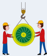
Fabrication de produits aérospatiaux