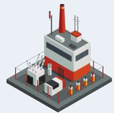
Fabrication de matériel de transmission de puissance