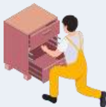
Fabrication de meubles et d'accessoires