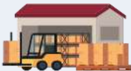
Grossistes, quincaillerie et matériaux de construction