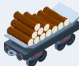
Fabrication d'autres produits en bois