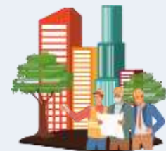
Entrepreneurs/entrepreneuses en travaux de finition de bâtiments