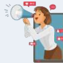
Publicité, relations publiques et services connexes