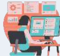
Conception de systèmes informatiques et services connexes