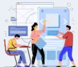
Services spécialisés de design