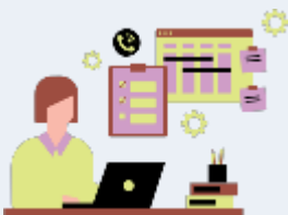
Services d'administration des gouvernements